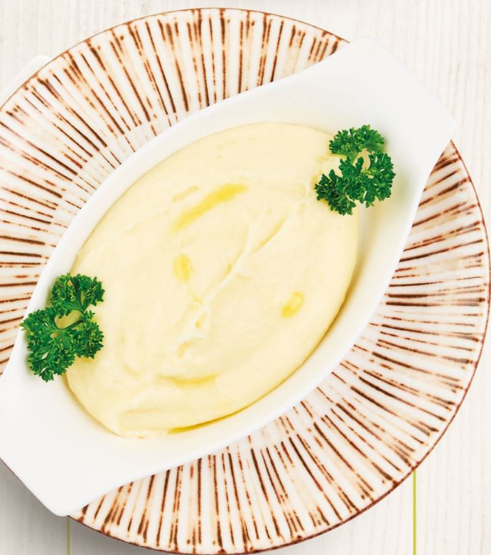
Картофельное пюре с трюфельным маслом и пармезаном Mashed potatoes with truffle oil & parmesan