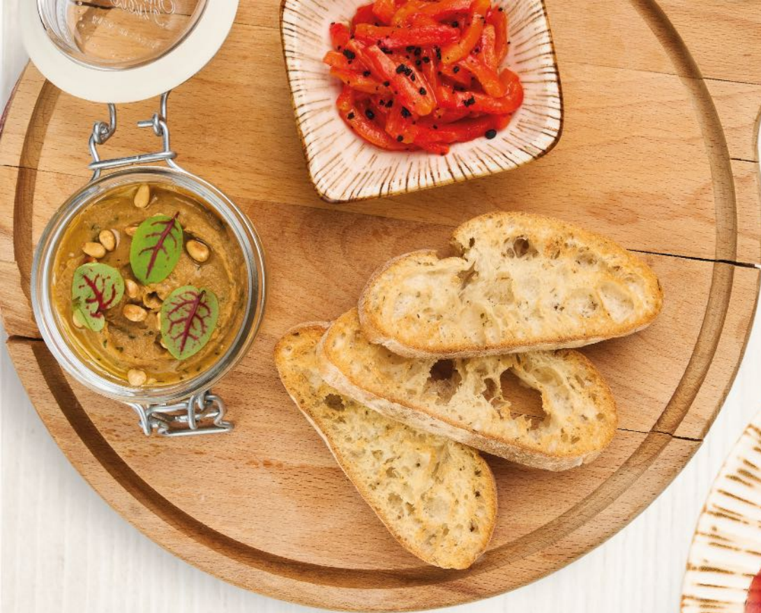
Мелидзано из баклажанов Melitzanosalata (Greek eggplant dip)