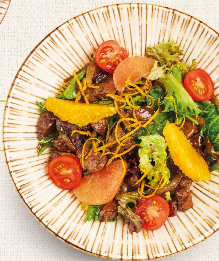
Теплый салат с куриной печенью Warm salad with chicken liver