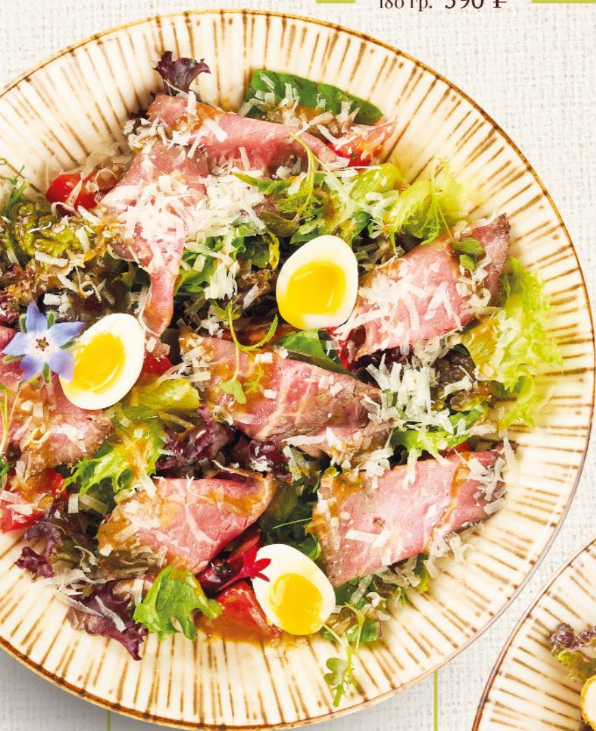
Салат с Ростбифом Roast beef salad