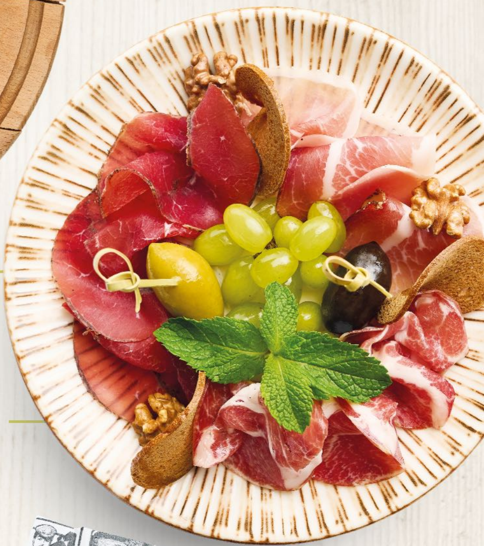
Антипаста Брезаола, Парма, Коппа Antipasti prosciutto, bresaola, coppa