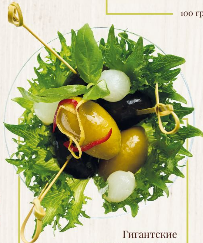
Гигантские оливки и маслины Giant black and green olives