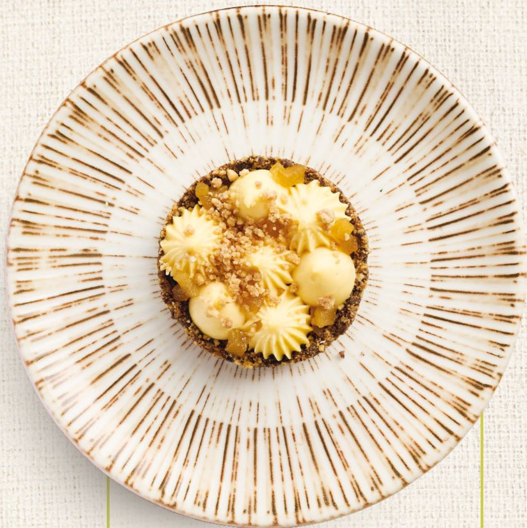
Тарталетка с грушей, крекером и фундуком Tartlet with pear, cracker and hazelnuts