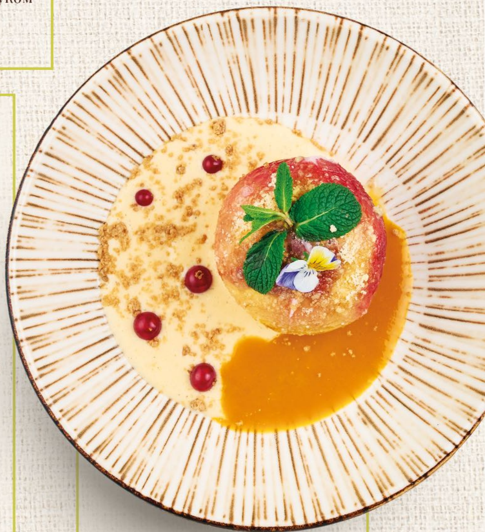
Запеченное яблоко с ванильно-абрикосовым соусом Baked apple with vanilla-apricot sauce

Заварная булочка Custard bun 70 гр. 170 ₺