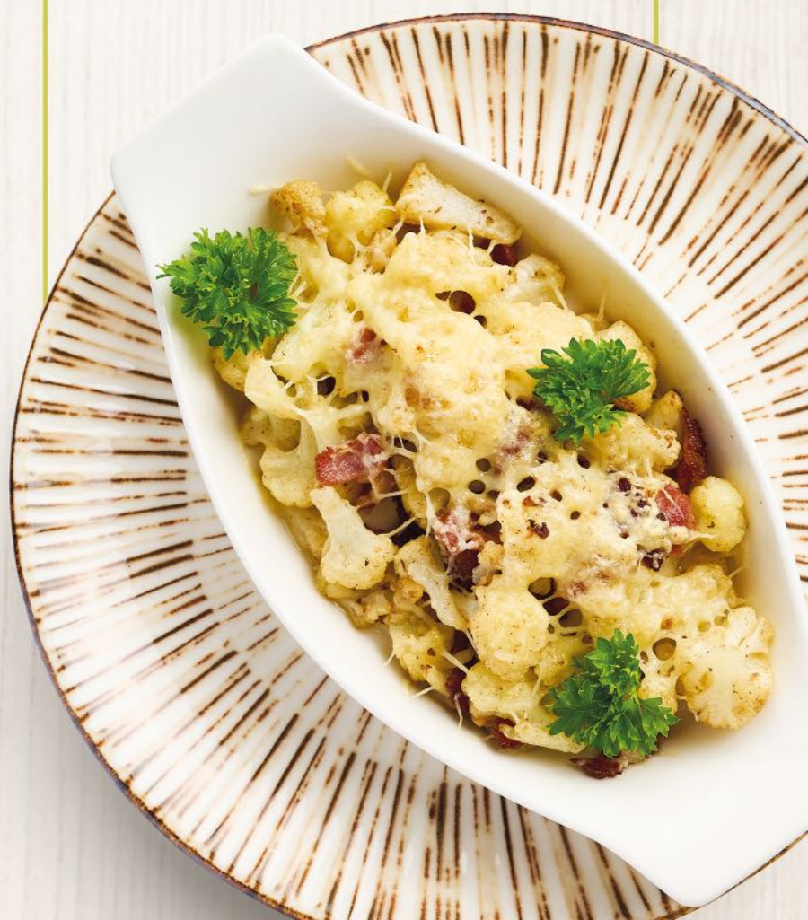
Цветная капуста с беконом и сыром Пармезан Cauliflower with bacon & Parmesan cheese