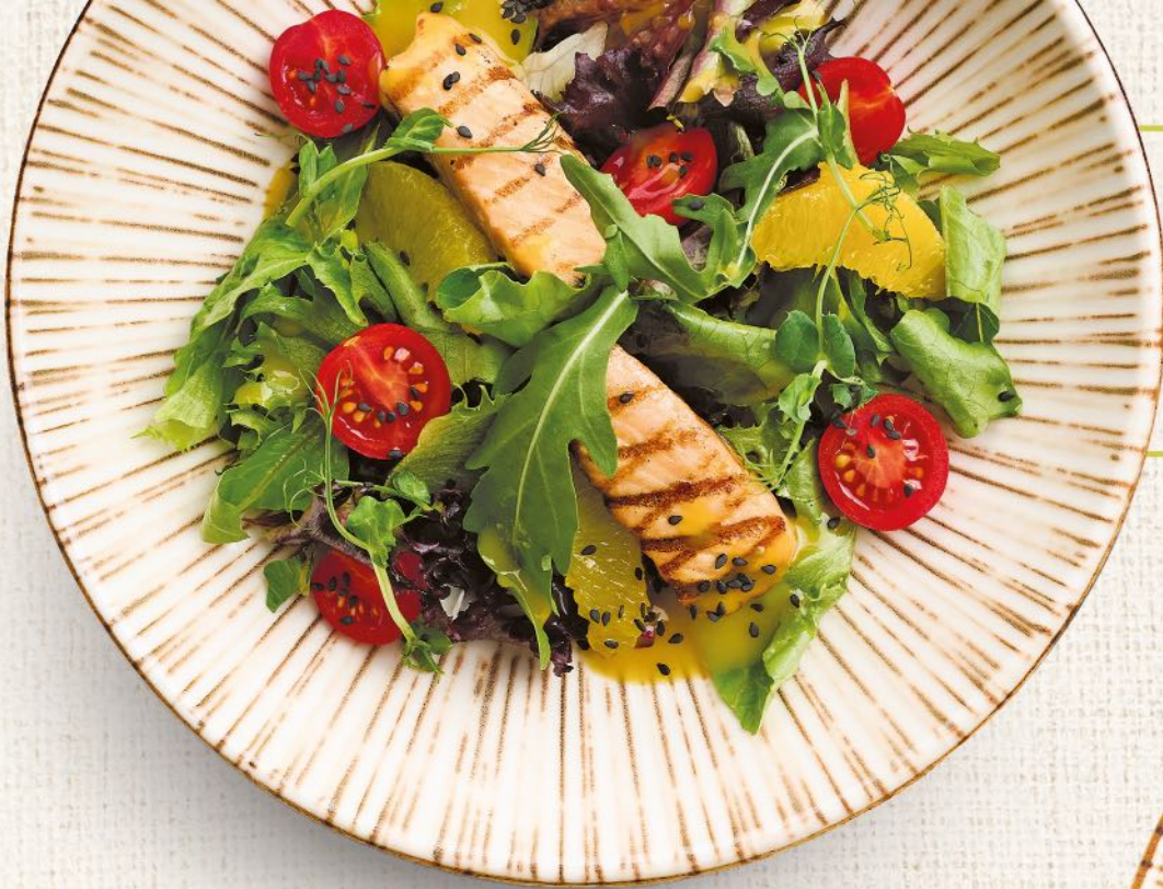
Салат с лососем гриль и апельсиново-имбирной заправкой Grilled salmon salad with orange-ginger dressing