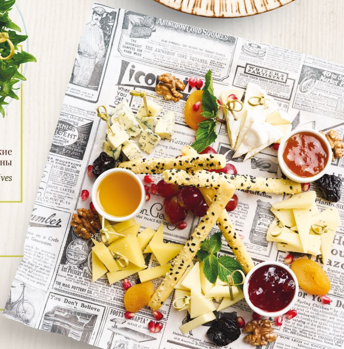
Сырное плато Cheese plate 150/40/40/40 гр. 1290 ₺